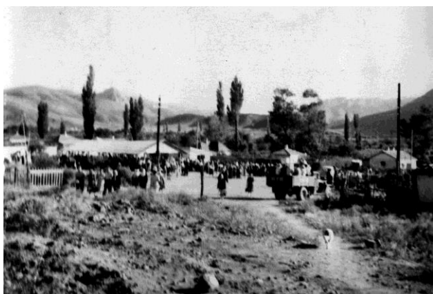
Рынок на месте будущей школы до войны.

В 1921 году наступивший голод прервал работу школы.