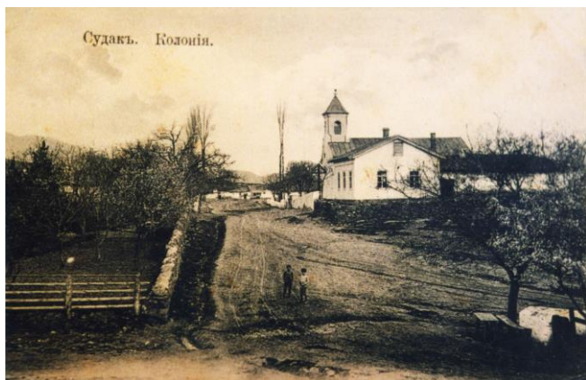
Школа в немецкой колонии.